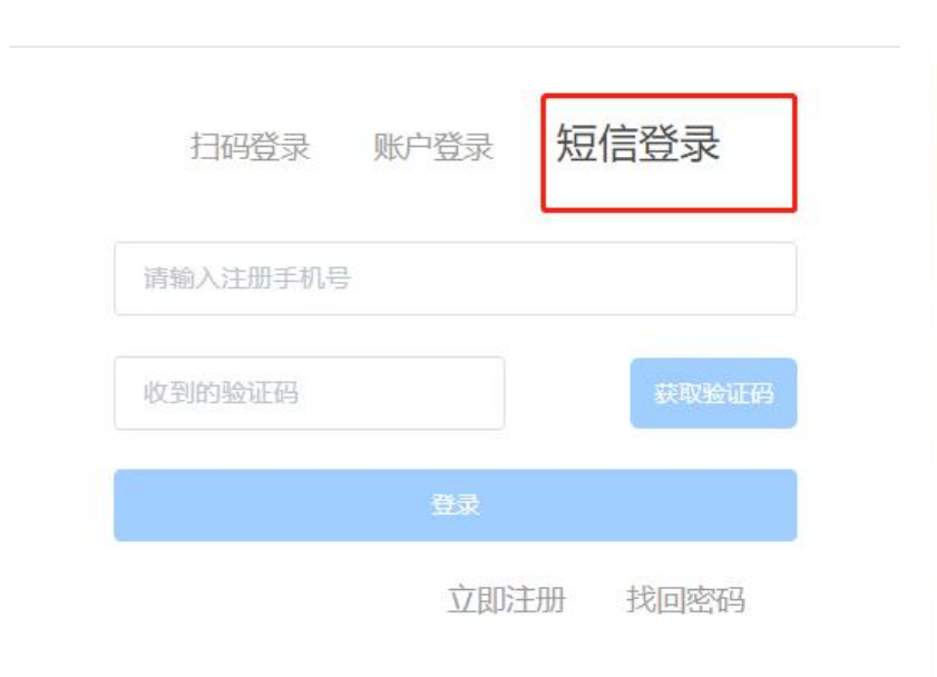
图 6 账号登陆

②登陆成功后，点击页面右上角头像，个人中心—个人设置—个人信息—修改—填写带*的选项-保存即可，如图 7。