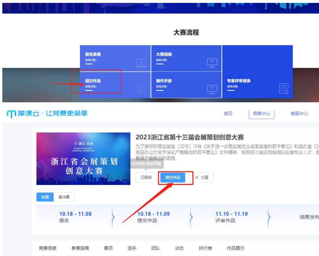
图 12 上传作品入口