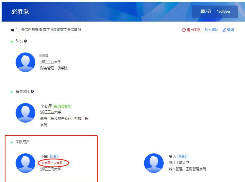
图 5 队伍信息详情页

注意： 队伍每位参赛选手都需要把个人信息填写完整，否则影响后续的上传参赛作品和做证书，团队队长需要督促提醒未补充的参赛队员登陆系统补充填写完整。