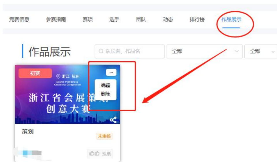
图 16 调整修改已上传作品

注意：①每个赛项提交的作品要求和附件要求以及格式都不一致，请按照赛项对应的作品要求进行提交。