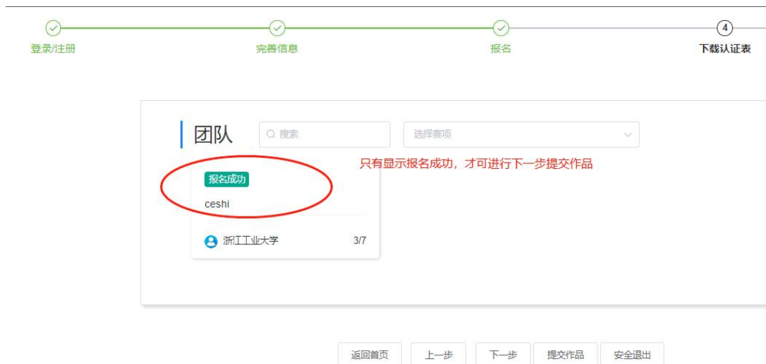
图 11 报名成功