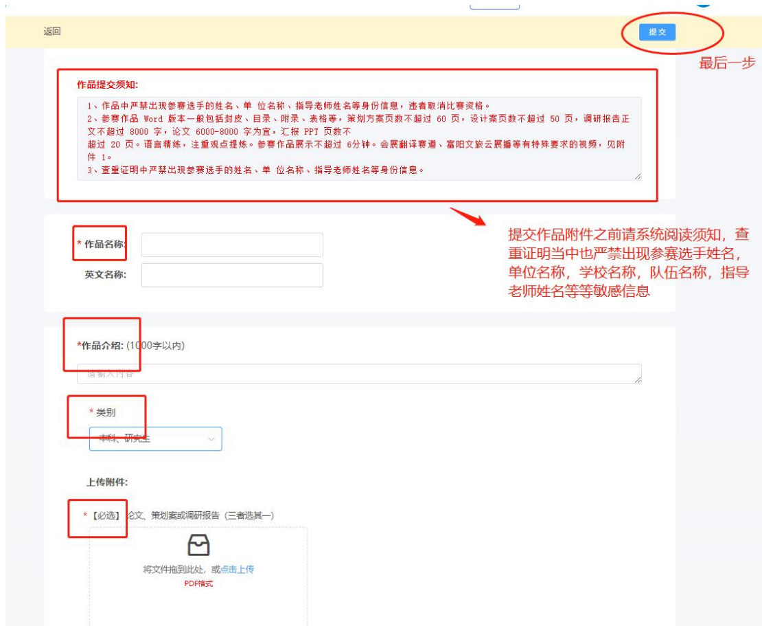
图 14 上传作品附件