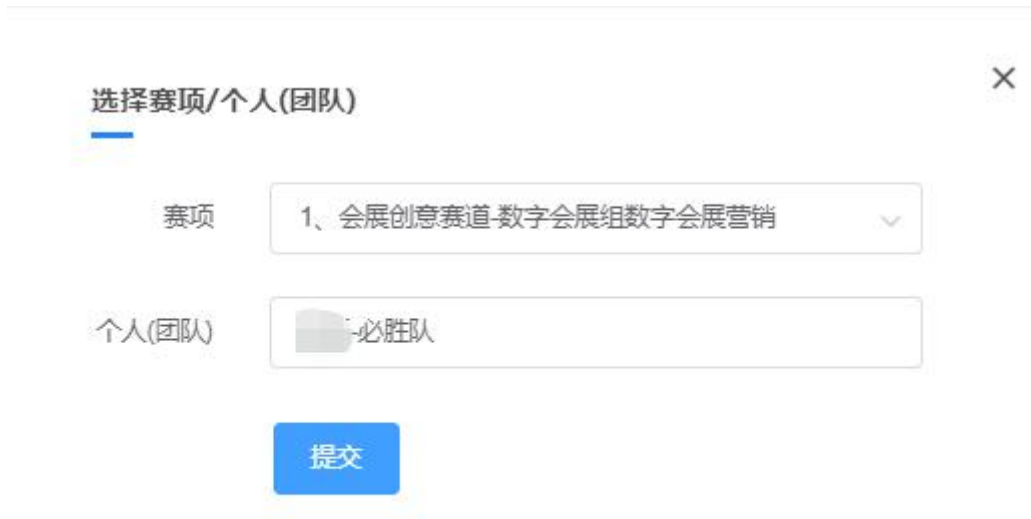
图 13 选择赛项/所在团队