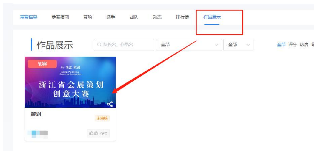
图 15 作品上传完成