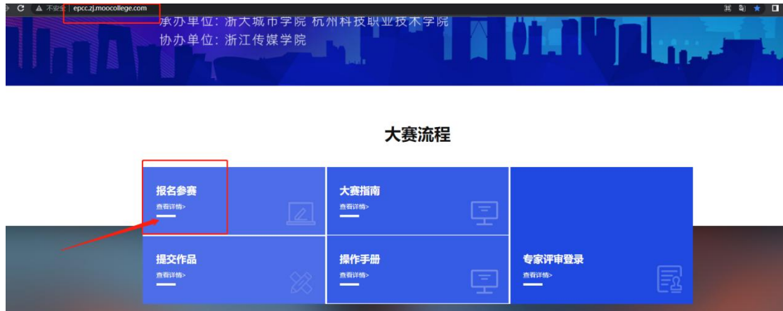
图 1 官网报名首页

1、登陆报名网址： http://epcc.zj.mooccollege.com/ ，点击报名参赛，如图 1。